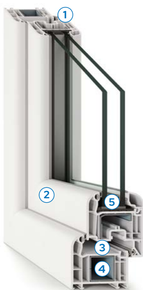
Design classico con linee arrotondate